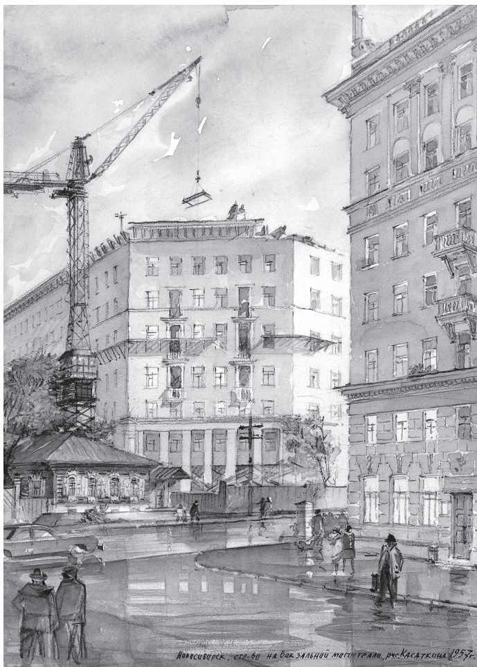
В. Касаткин. Строительство на Вокзальной магистрали. 1957 г.

Рисунки Касаткина «Бани Федорова. 1957 г.» и «Застройка по ул. Советской. 1958 г.» изображают одну из старейших в городе площадей, которая