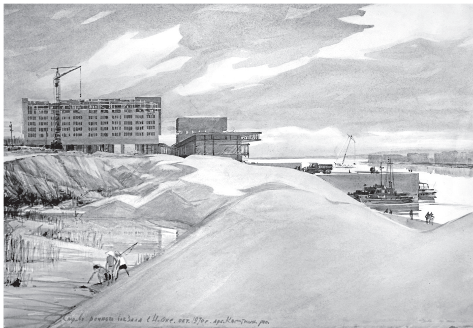
В. Касаткин. Строительство Речного вокзала. 1970 г.

сегодня носит имя Кондратюка. В конце XIX века это была северная окраина поселка, за которой начинался лес. Когда-то площадь называлась Андреевской и служила точкой, через которую можно было переехать из центральной части города в вокзальную. Иначе никак, поскольку эти две части разделял глубокий овраг, сейчас зарытый — Михайловский лог. По дну оврага бежал ручеек, который брал свое начало как раз с площади, точнее — из озера под названием Круглое, находившегося на ее краю. За обильную грязь водоем называли еще «средионаземным морем».